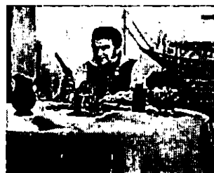
Les Rolling Stones dans « One plus One » de Jean-Luc Godard.